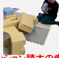
＜クッション積木の療育＞

つきひの畑で初めてジャガイモ・スナップエンドウなどを育て、みんなで作る昼食の材料として利用、おいしくいただきました。