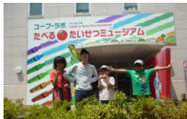
ミュージアム入口

夏休み中のイベント行事として、県外へのお出かけ 8月1日～9日にかけて「コーブラボ・たべる＊たいせつミュージアム」へグループ別に見学しました。そして、突然登場した「トマトキャラクター」にみんな大興奮、楽しそうでした。