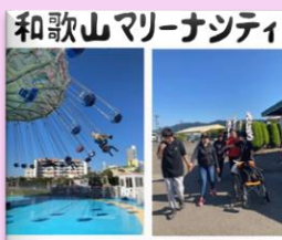
和歌山マリーナシティ