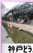
神戸どうぶつ王国